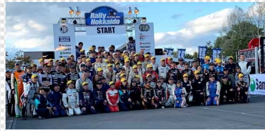
Rally HOKKAIDO 19-22 Sep. 2019